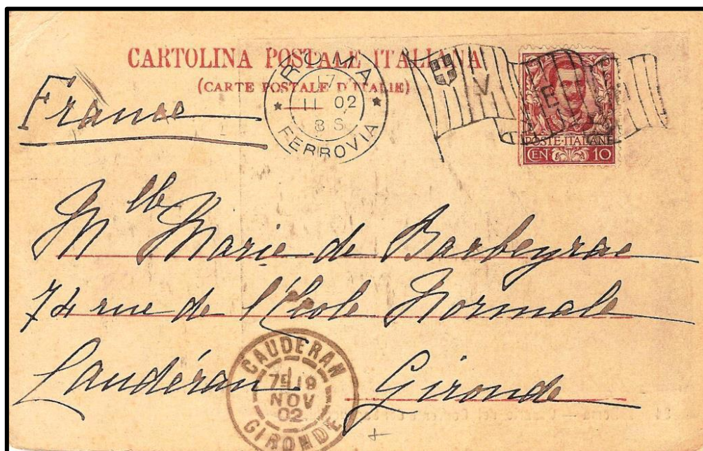
Figure 3 : Oblitération « drapeau » italienne utilisée dans le bureau de poste de la gare centrale de Rome le 11 février 1902, sur carte postale à destination de Landéran (F).