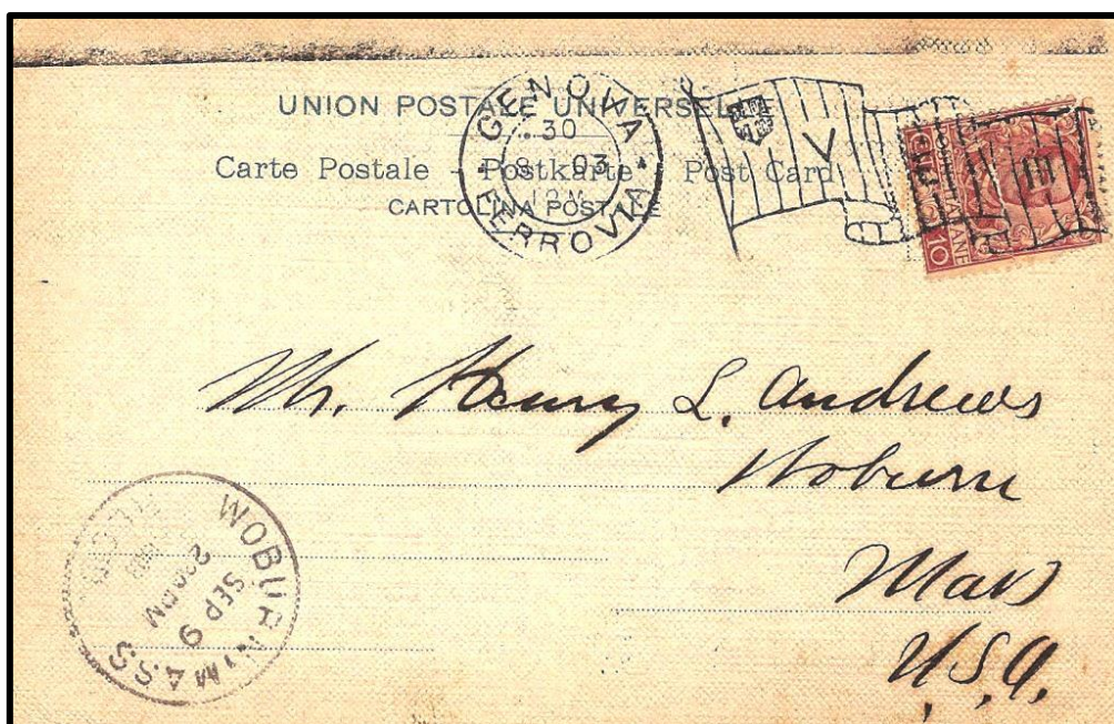
Figure 4 : Oblitération « drapeau » italienne utilisée dans le bureau de poste de la gare centrale de Genes le 30 août 1903, sur carte postale à destination de Woburn (USA).