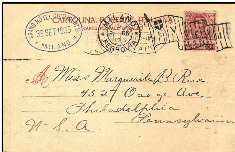
Figure 2 : Oblitération « drapeau » italienne utilisée dans le bureau de poste de la gare centrale de Milan le 3 septembre 1905, sur carte postale à destination de Philadelphie (USA).