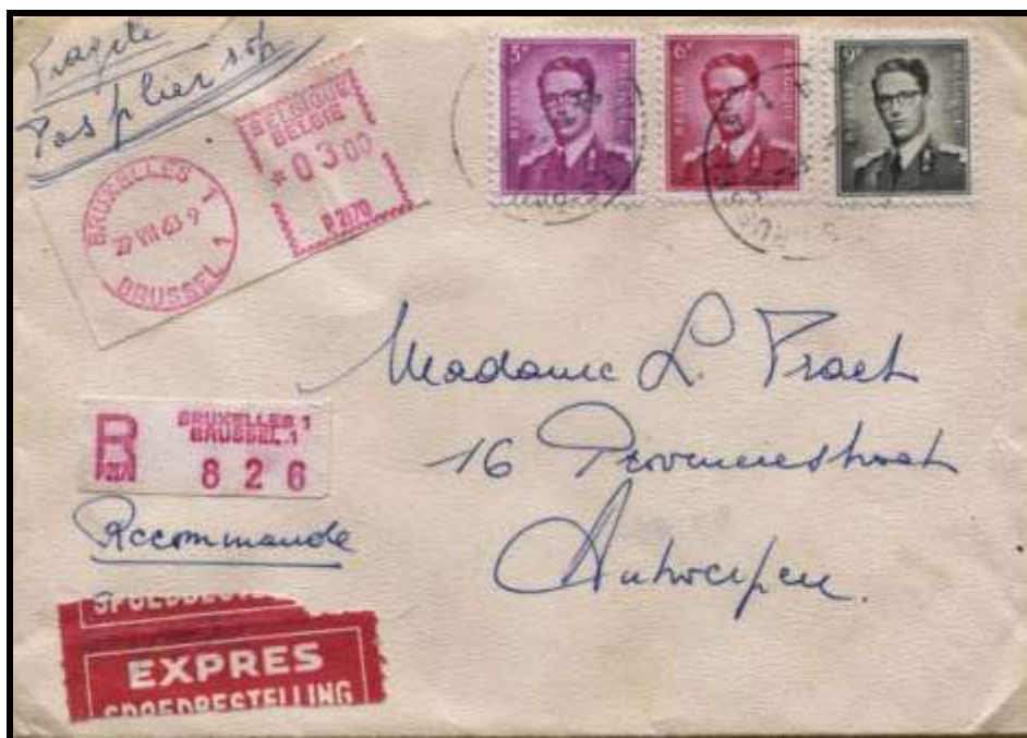
Fig.13 : Lettre recommandée envoyée en EXPRES de Bruxelles 1, le 22 juillet 1963, à destination d'Anvers, affranchie avec les TP n° 1067, 1069 et 1073 ainsi que d'une vignette d'affranchissement de 3 FB.

La lettre recommandée a été envoyée en EXPRES de Bruxelles 1, le 22 juillet 1963, à destination d'Anvers.