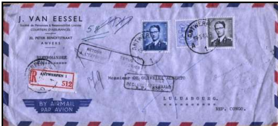
Fig.17 : Lettre recommandée envoyée d'Anvers le 19 mai 1961 à destination de Luluabourg (République du Congo) et non réclamée est renvoyée à l'expéditeur. La lettre est affranchie à 13,5 FB.

La fig.17 illustre une lettre recommandée envoyée par avion d'Anvers le 19 mai 1961 à destination de Luluabourg (République du Congo). Elle est affranchie au tarif exact de 13,5 FB par les TP n° 854, 926 et 1073. En effet le port pour la lettre ordinaire est de 6,5 FB au tarif du 1 er avril 1959 et la taxe de recommandation est de 7 FB, soit un total de 13,5 FB.