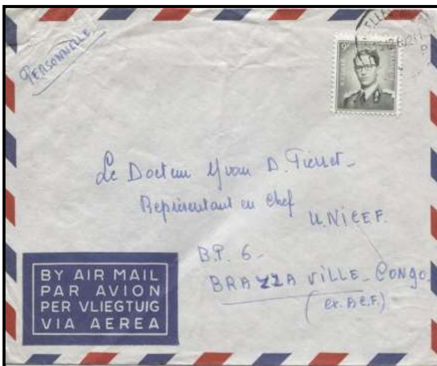
Figure 5 : Lettre envoyée par avion de Bruxelles, le 16 décembre 1960, vers Brazzaville (Congo français).