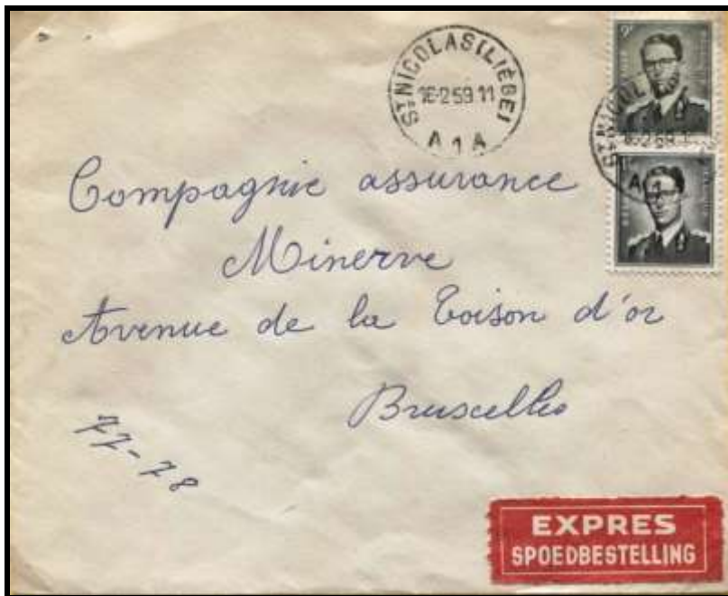
Figure 7 : Lettre envoyée par EXPRES de St-Nicolas (Liège), le 16 février 1959 à destination de Bruxelles.

L'affranchissement se décompose en tarif pour la lettre ordinaire de 2,5 FB (tarif au 1 er octobre 1957) et de 8,0 FB pour la taxe d'EXPRES, soit un total de 10,5 FB.