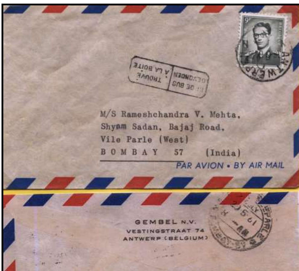
Figure 4 : Lettre envoyée par avion d'Anvers, le 16 mai 1961, vers Bombay (Inde).

Au verso se trouve le cachet d'arrivée à Bombay, daté du 19.5.1961. La lettre a donc mis trois jours pour arriver à destination.