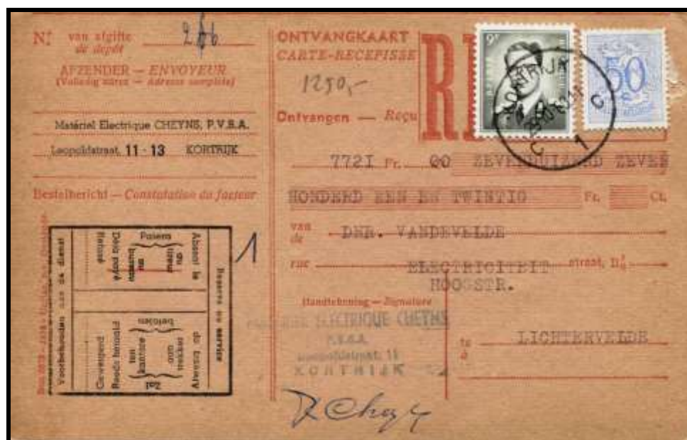
Fig.14 : Carte-récepissé d'un montant de 7.721 FB, affranchi à 9,5 FB par TP n° 854 et 1073.