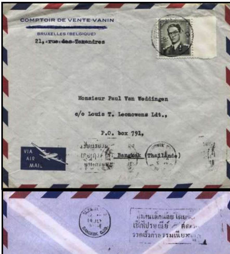
Figure 2 : Lettre envoyée par avion d'Etterbeek, le 9 juillet 1959, vers Bangkok (Thaïlande). Au dos, cachet d'arrivée à Bangkok le 14 juillet.