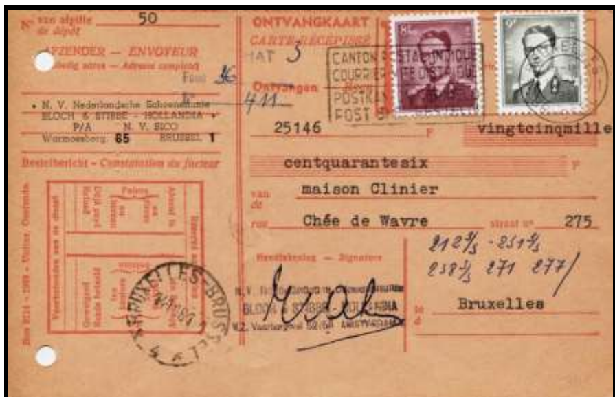
Fig.15 : Carte-réçipissé d'un montant de 25.146 FB, affranchi à 17,5 FB par TP n° 1072 et 1073.