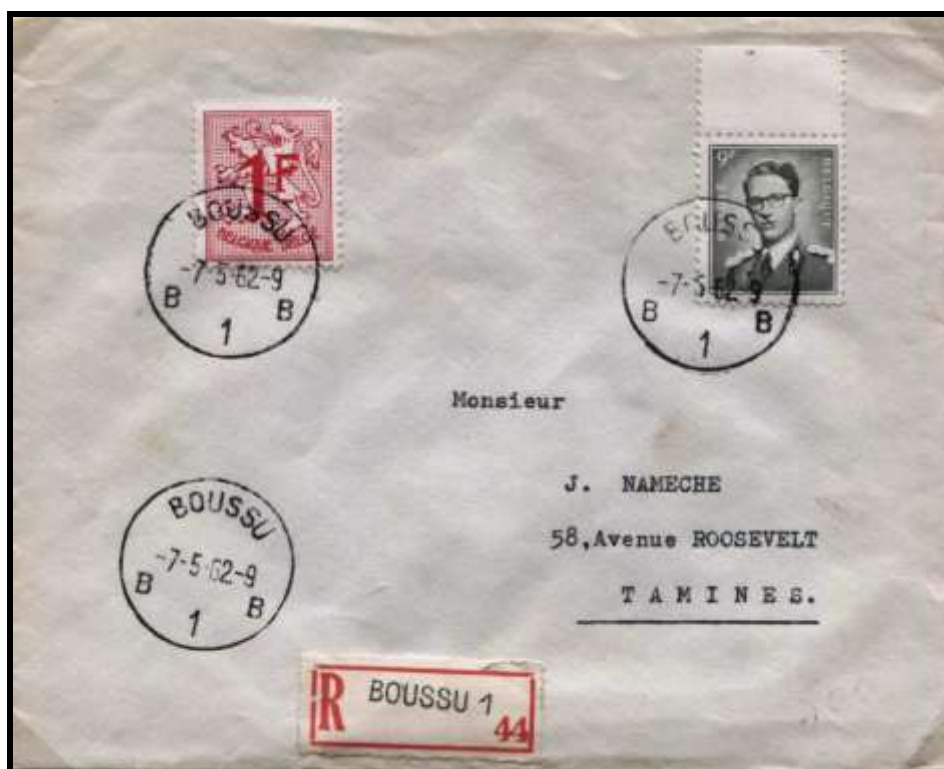
Fig.11 : Lettre recommandée envoyée de Boussu le 7 mai 1962 à destination de Tamines, affranchie avec les TP n° 1027B et 1073.

La lettre recommandée représentée à la fig. 11 est une variante où le timbre complémentaire est cette fois le n° 1027B, le 1 FB rose grand format émis le 14 décembre 1960.