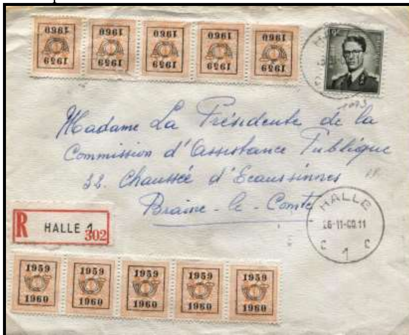
Fig.9 : Lettre recommandée envoyée de Halle le 16 novembre 1960 à destination de Braine-le-Comte.

Le tarif est cependant exact à 10 FB, composé de 3 FB pour la lettre ordinaire (tarif au 1.11.1959) et de 7 FB pour la taxe de recommandation.