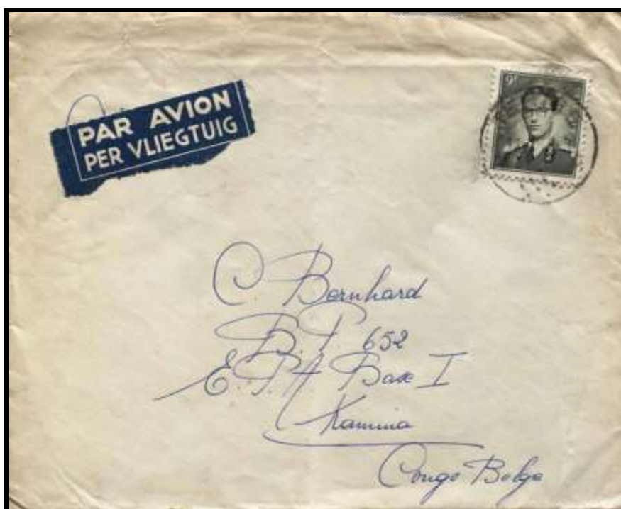
Figure 3 : Lettre envoyée par avion de Tertre, le 13 janvier 1960, vers la base militaire de Kamina (Congo belge).