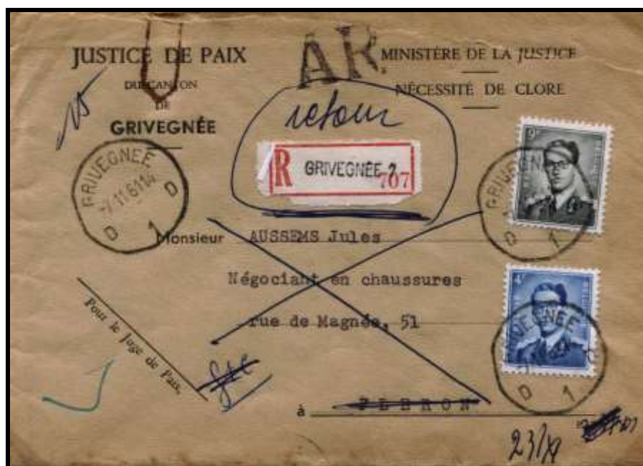
Figure 6 : Lettre recommandée envoyée de Grivegnée le 7 novembre 1961 à destination de Fleron.

Le destinataire n'ayant pas été trouvé, la lettre recommandée a été renvoyée à l'expéditeur.