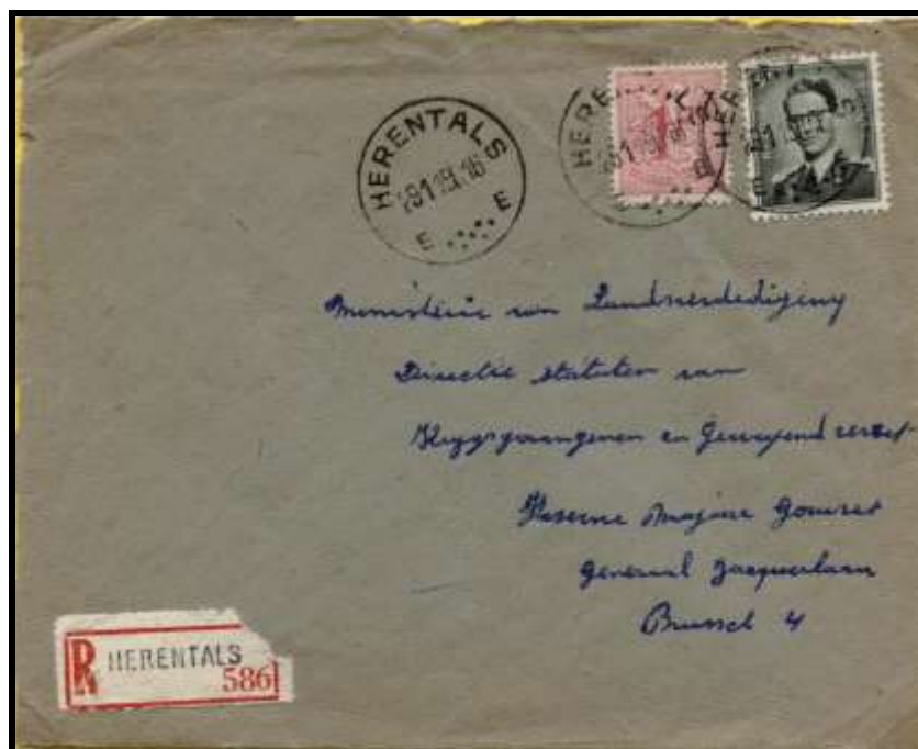
Fig.10 : Lettre recommandée envoyée d'Herentals 29 novembre 1960 à destination de Bruxelles 4 (Etterbeek), affranchie avec les TP n° 859 et 1073.

Par contre, la lettre recommandée (fig.10), est affranchie de façon admise à l'aide d'un TP n°1073 et d'un TP n°859, le 1 FB rose de l'émission de 1951.