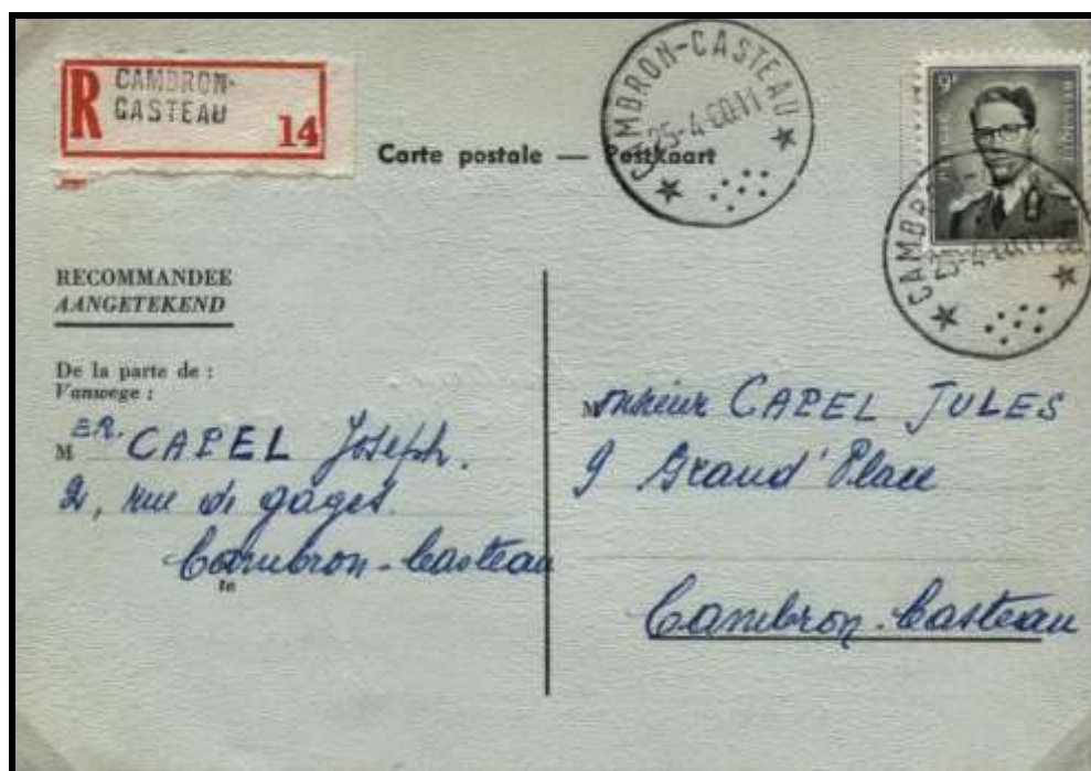
Figure 1 : Carte postale recommandée envoyée du dépôt-relais de Cambron-Castiau le 25 avril 1960 vers un membre de la famille habitant la même localité.

La fig. 1 illustre une carte postale envoyée en recommandé de Cambron-Casteau en avril 1960, vers un membre de la famille habitant la même localité. Le TP n° 1073 couvre le tarif exact pour cet envoi. En effet le tarif du 1 er novembre 1959 pour la CP est de 2 FB et la taxe de recommandation est de 7 FB, soit un total de 9 FB.