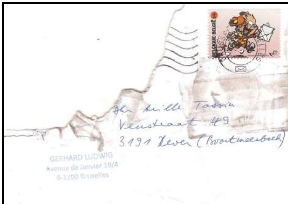
Fig. 1 : lettre endommagée reçue récemment par un de nos membres

La lettre dûment affranchie et oblitérée à Bruxelles X le 25.07.2015 est partiellement arrivée à son destinataire. Quand je dis partiellement c'est vu l'état dans lequel la lettre est arrivée (fig. 1).