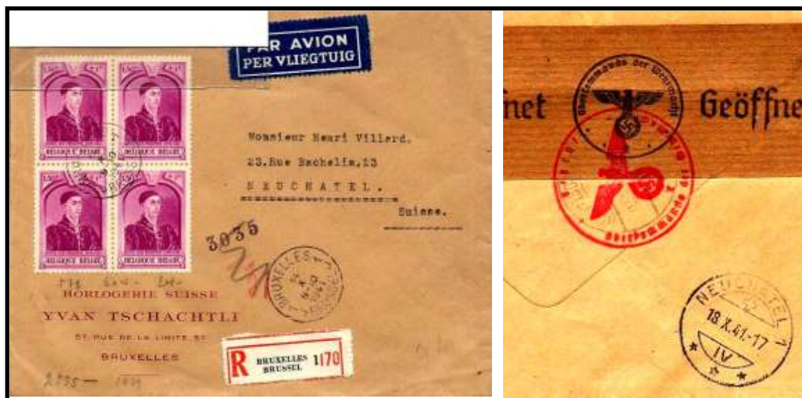
Fig. 3 : lettre par avion ( ? ) de Bruxelles à Neuchatel (CH) du 18 octobre 1941 (réduit)

Les lettres par avion avant la guerre étaient libres d'une taxe de poste aérienne pour la Suisse, mais le service entre Zurich (CH) et Stuttgart (D) en requierait un.