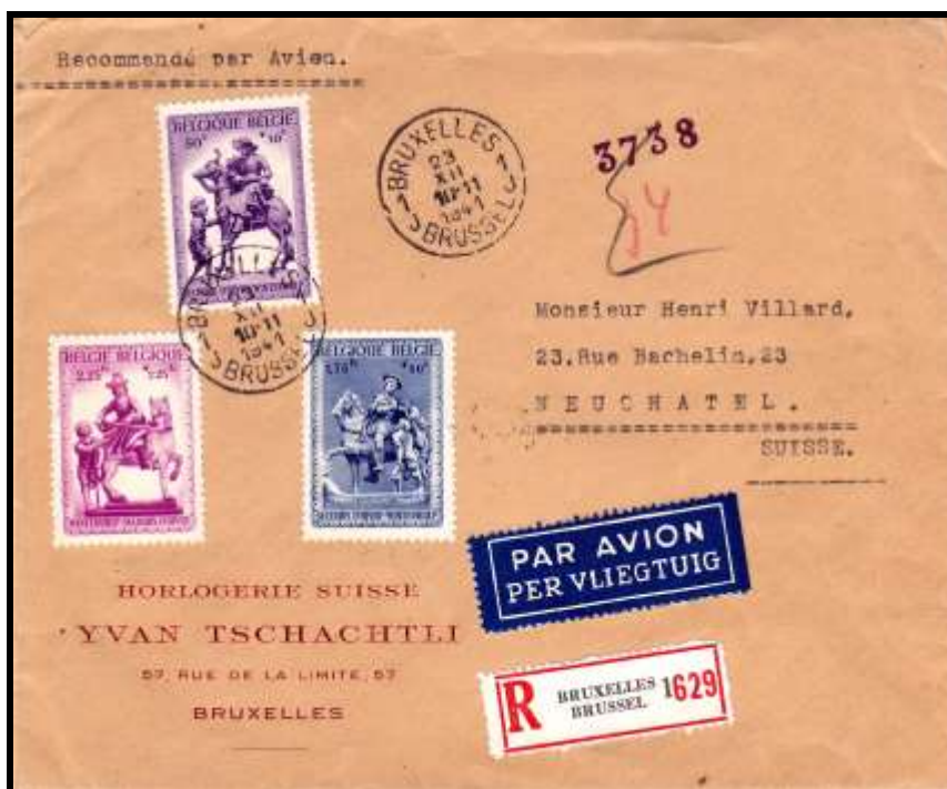
Fig. 1 : lettre par avion ( ? ) de Bruxelles à Neuchatel (CH) du 23 décembre 1941 (réduit à 66 %)

La première a été postée le 23 Décembre 1941 et est arrivée à Neuchâtel le 31 décembre, ce qui était un temps tout à fait normal pour un voyage ferroviaire pendant la période de Noël.