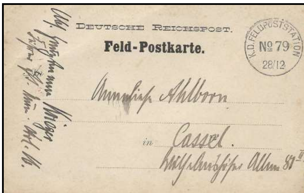
Fig. 1 : Recto de notre carte postale, écrite le 24 décembre 1914 par le capitaine Krieger et envoyée vers Cassel, en franchise de port, par le moyen de la F.P.n°79, secteur postal allemand dont dépend le militaire.