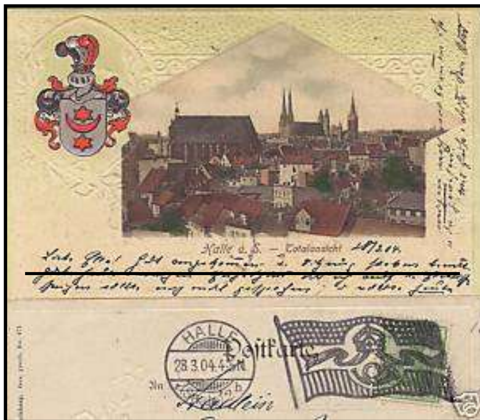
Figure 3 : Verso et partie du recto d'une carte postale de Halle (D) portant une oblitération « drapeau » type 2 de l'Empire allemand, du 23 mars 1904 vers Halle (D).