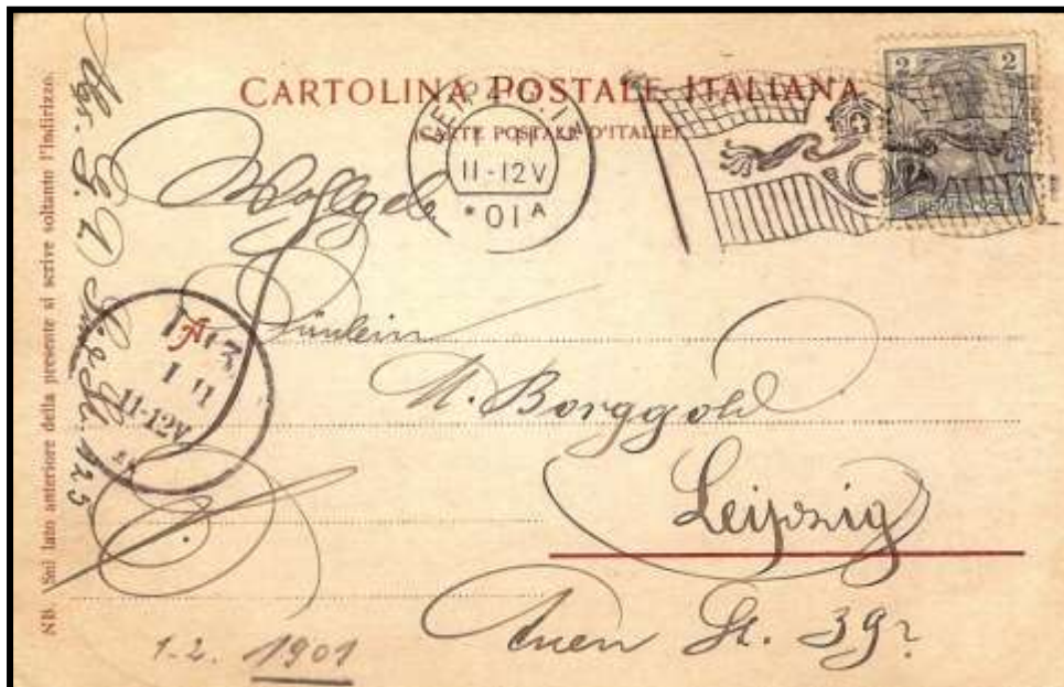
Figure 2 : Oblitération « drapeau » type I de l'Empire allemand sur carte postale italienne, du 1 er février 1901 vers Leipzig (D).