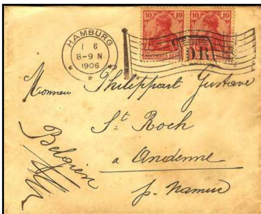
Figure 4 : Oblitération « drapeau » sur lettre de Hamburg (D), datée du 1 er juin 1906, à destination d'Andenne (B).

Au centre du drapeau les lettres « D.R. » signifient « DEUTSCHES REICH ».