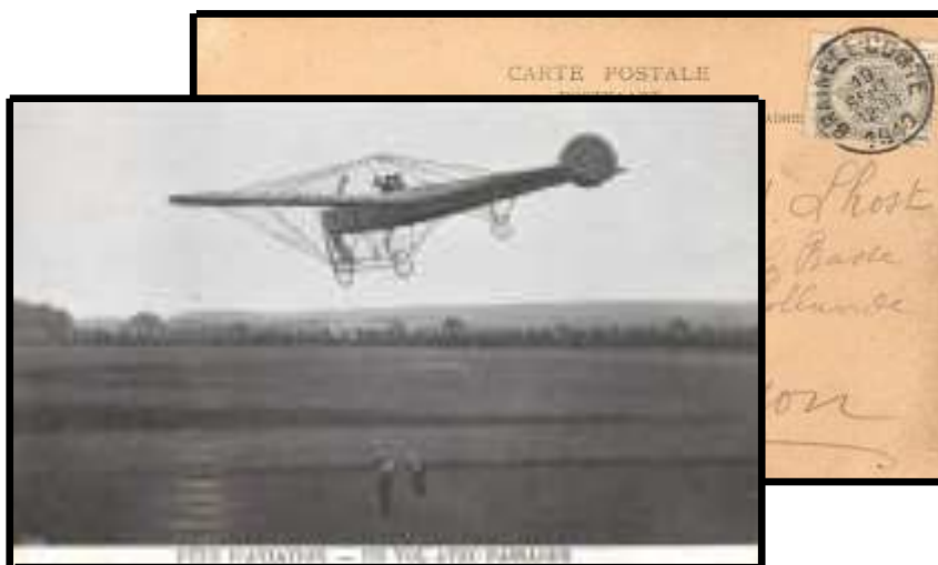
Fig.4 : recto et verso d'une carte postale postée lors du meeting d'aviation de Braine-le-Comte, postée le lundi 19 sept. 1910 de Braine-le-Comte vers Hyon.