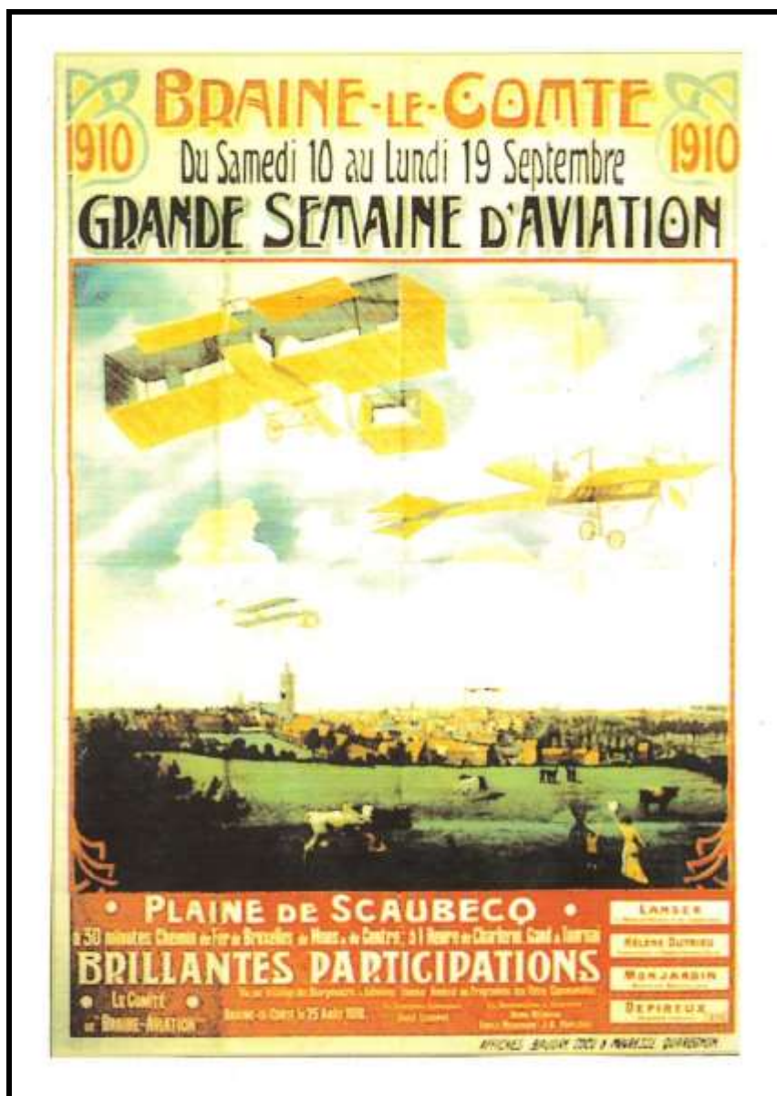
Fig.1 : affiche officielle annonçant la grande semaine d'aviation de BRAINE-LE-COMTE, ayant lieu du 10 au 19 septembre 1910.