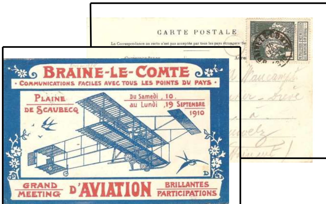
Fig.2 : recto et verso de la carte postale de propagande du meeting d'aviation de BRAINE-LE-COMTE, postée le vendredi le 16 septembre 1910 de BRAINE-LE-COMTE vers PERUWELZ.

John DEMONJOZ , pilote suisse né à Genève en avril 1886, invente en 1913 avec Adolphe PEGOUD la voltige aérienne et ils seront les premiers à réaliser des loopings.