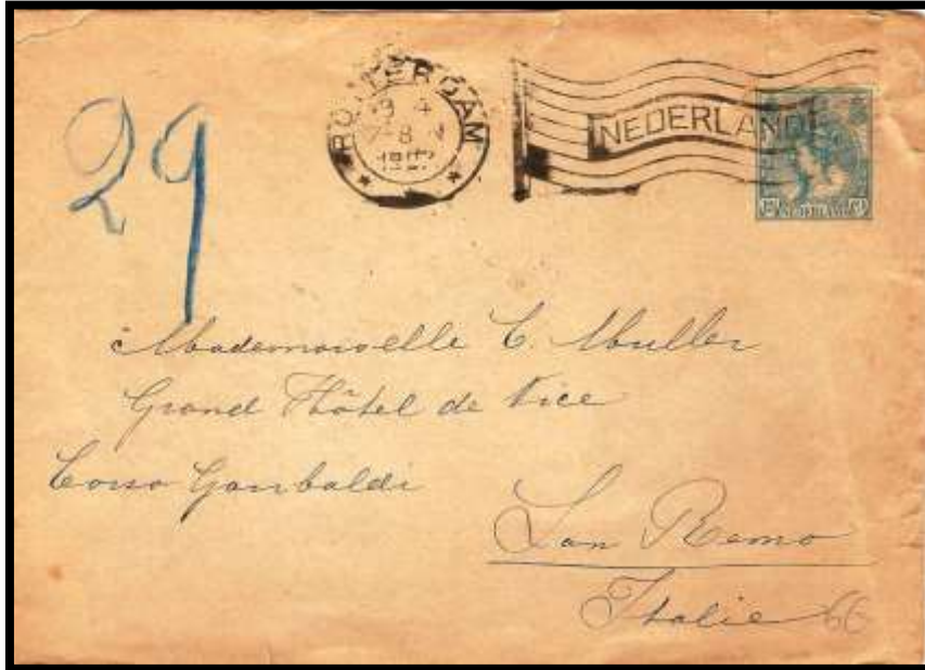
Figure 2 : Oblitération « drapeau » sur lettre de ROTTERDAM (NL), datée du 9 avril 1907, à destination de SAN REMO (I).

L'impression des oblitérations « drapeau » hollandaises est souvent empâtée (fig. 2) et rarement de bonne qualité (fig. 3).