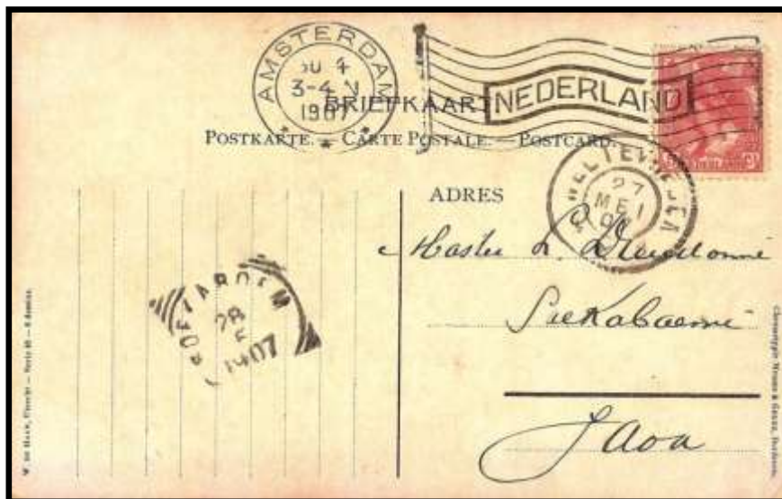
Figure 3 : Oblitération « drapeau » sur lettre d'AMSTERDAM (NL), datée du 30 avril 1907, à destination de SAEKABAEMI (Java).