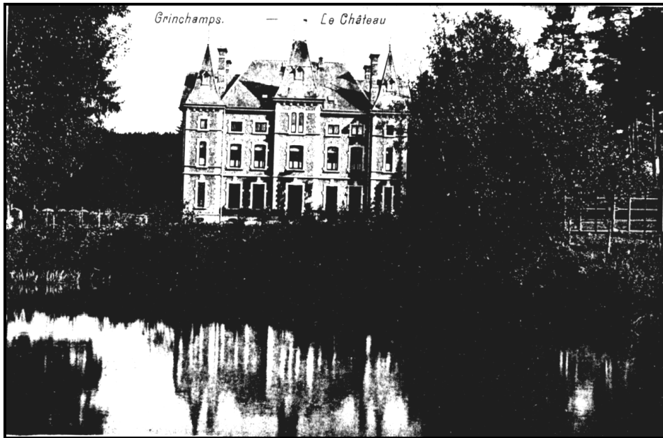
Figure 2. : Carte Postale illustrant le château de GRAINCHAMPS vers 1948.

Le modeste hameau de GRAINCHAMPS, relais de poste comparable à celui de FLAMISOULLE, redonnait pour le temps d'une guerre son nom à une marque postale.