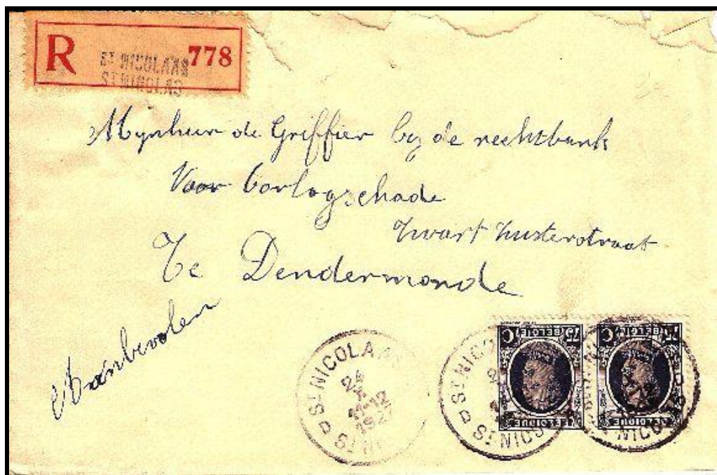
Fig. 1 : Paire du 75c HOUYOUX sur lettre RECOMMANDEE de St-NICOLAS à TERMONDE, du 24.X.1927. Tarif 1,50 F pour la LO RECOMMANDEE en service intérieur du 1.XI.1926 au 14.XII.1927.