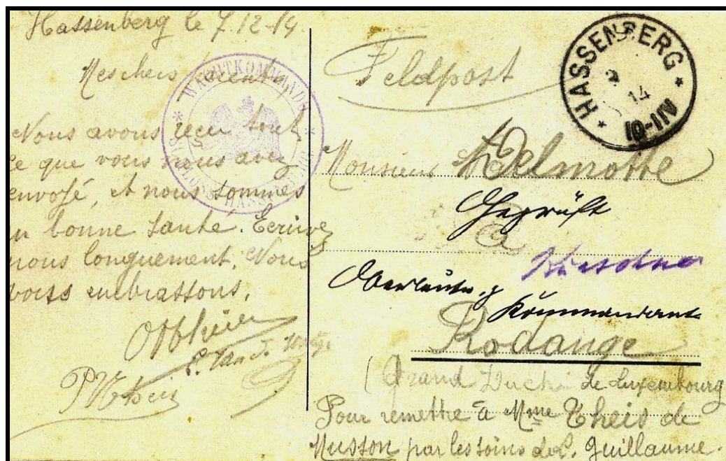
Figure 1 : Verso de la carte-vue envoyée le 7 décembre 1914 d'HASSENBERG à destination de MUSSON.

A la partie supérieure du document on voit le cachet postal, au dateur incomplet, d'HASSENBERG (... 14 / 10-11 v), le cachet violet, double cercle avec un aigle au centre, du camp de prisonniers : « Wachtkommando / Schloss Hassenberg » (Commando de garde / château de Hassenberg), le tout surmonté d'une inscription manuscrite « Feldpost ».