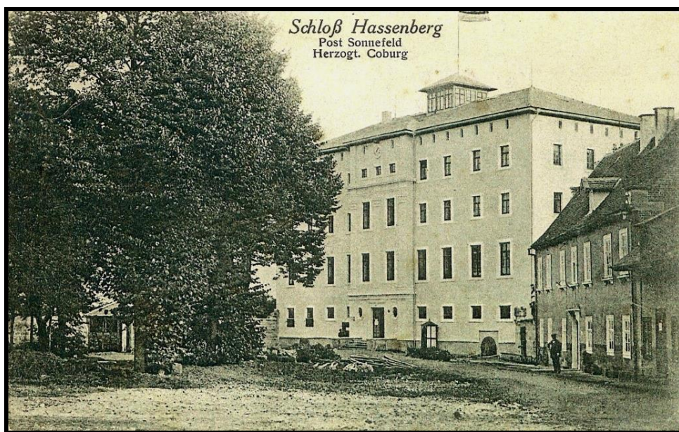
Figure 2 : Recto de la carte-vue envoyée le 7 décembre 1914 d'HASSENBERG à destination de MUSSON.

Au recto, nous découvrons une photo du château d'Hassenberg, leur lieu d'internement, accompagnée du texte suivant : « Schloss Hassenberg / Post Sonnefeld / Herzogt [um] Coburg » (château d'Hassenberg / Post Sonnefeld / Duché de Cobourg).