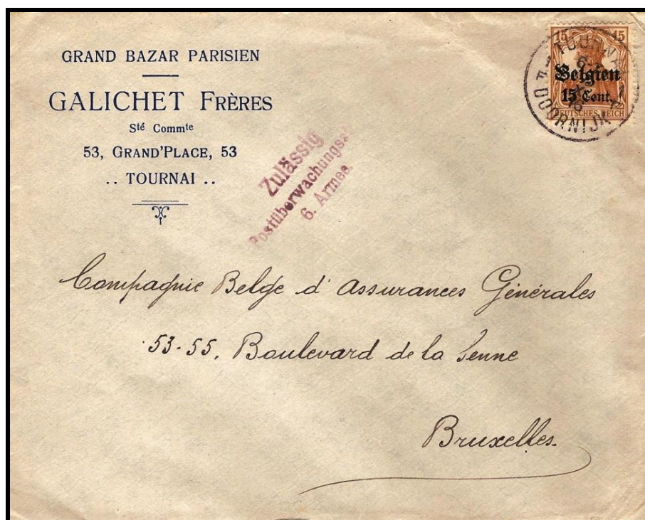
Fig. 1 : Cachet original en violet sur lettre de TOURNAI, datée du 7 octobre 1916, vers BRUXELLES.

Cette estampille est relativement facile à trouver et est sans doute représentée en plusieurs exemplaires dans des collections spécialisées.