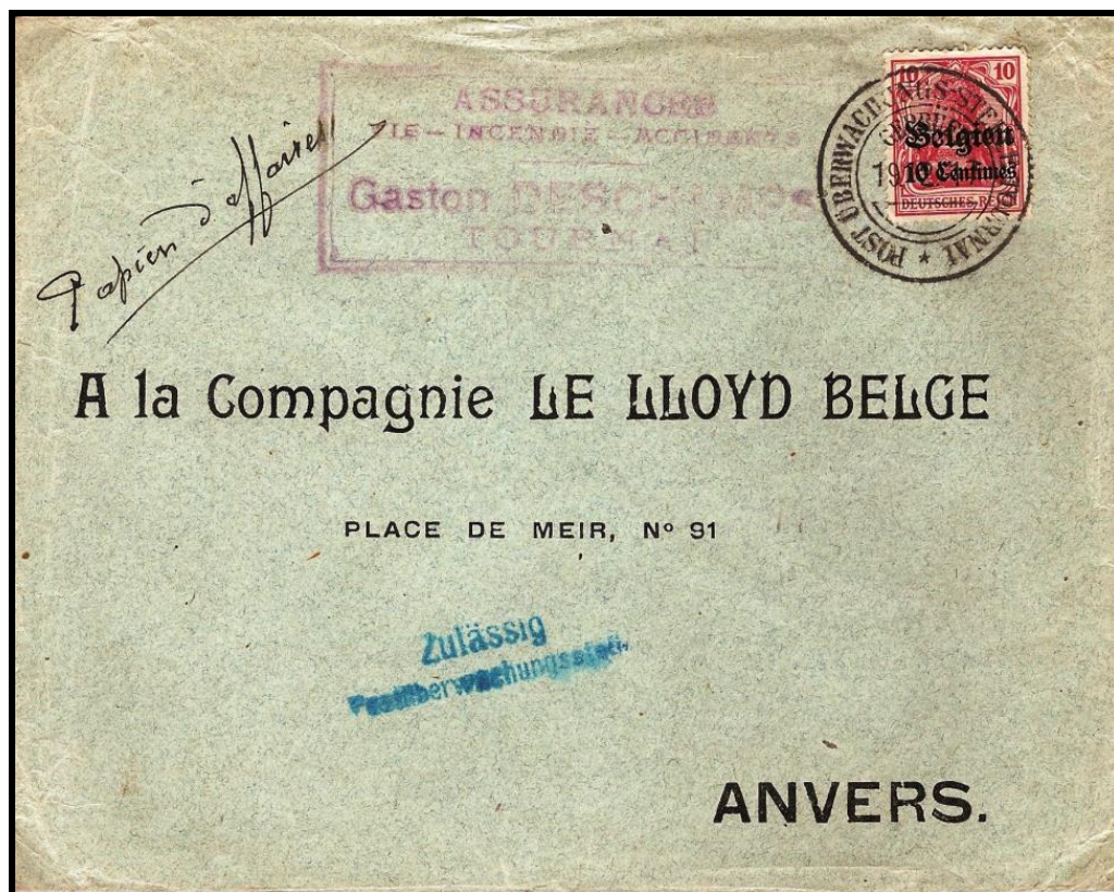
Fig. 3 : Cachet amputé en bleu sur lettre de TOURNAI, datée du 19 février 1917, vers ANVERS.