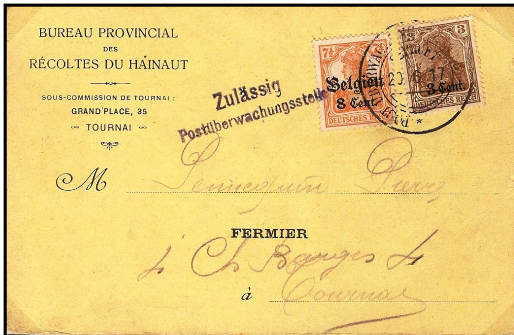
Fig. 4 : Cachet amputé en violet-noir sur carte postale de TOURNAI, datée du 20 juin 1917, en service local. Affranchissement mixte de timbres-poste du Gouvernement Général et des Etapes.