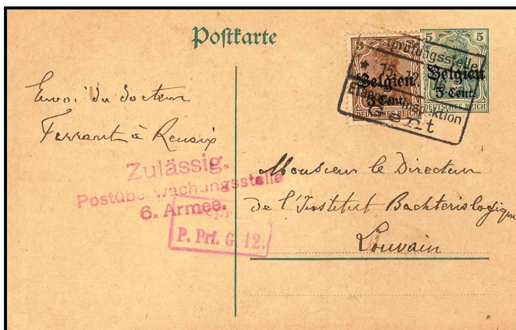
Fig. 6 : Carte postale de RENAIX, datée du 15 décembre 1916, vers LOUVAIN via GAND.

La durée d'utilisation connue de ces estampilles va du 6 octobre 1916 jusqu'au 22 décembre 1916.