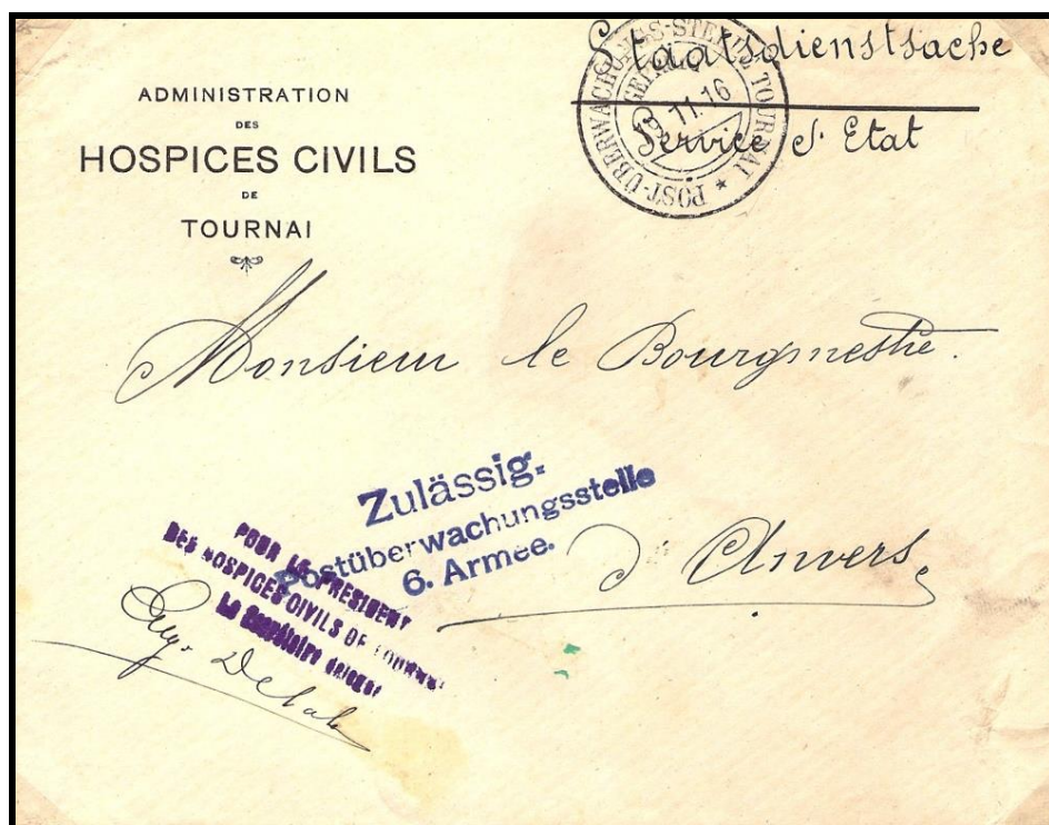
Fig. 3 : « POST-ÜBERWACHUNGS-STELLE TOURNAI » sur lettre datée du 19 novembre 1916, des Hospices Civils de TOURNAI (estampille en bleu).