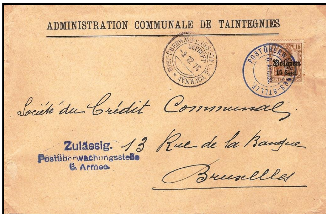
Fig. 4 : « POSTÜBERWACHUNGS-STELLE (au milieu : « 6. ARMEE ») sur lettre de la commune TAINTEGNIES (estampille en bleu).

Mais cette marque existe aussi en rouge et en lilas sur des correspondances privées de ou vers le Hainaut (fig. 5 et 6).