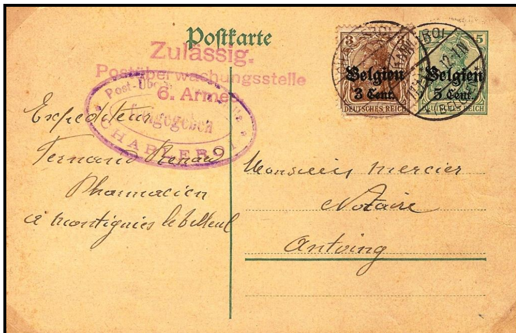
Fig. 5 : Carte postale de CHARLEROI, datée du 11 décembre 1916, vers ANTOING (estampille en rouge).

Mais cette marque existe aussi en rouge et en lilas sur des correspondances privées de ou vers le Hainaut (fig. 5 et 6).