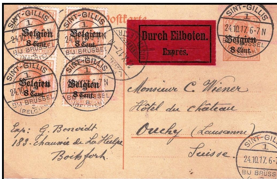
Fig. 1 : Entier postal de 8 c. affranchi par 4 fois 8 c. complémentaires, envoyé par exprès en service international.

Le premier concerne un entier postal de 8 c., qui est tout à fait courant, avec quatre timbres de 8 c., tout à fait courants eux aussi (fig. 1). Tout semble donc parfaitement anodin.