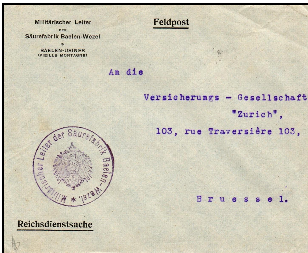
Figure 3 : Lettre à en-tête de l'usine Baelen-Wezel utilisée pendant l'occupation allemande de l'usine.(collection G. Ludwig).

En 1916, la « Vieille-Montagne » refuse de travailler pour l'occupant.