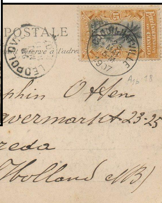
Carte-vue de Dakar / Sénégal partie de Coquilhatville le 23 mai 1907 à destination de Breda / Pays-Bas où elle parvint le 1er juillet ; passage par Léopoldville le 29 mai.

Tarif : carte-vue internationale : 15 c - affranchissement : 15 c ocre - I+A1b