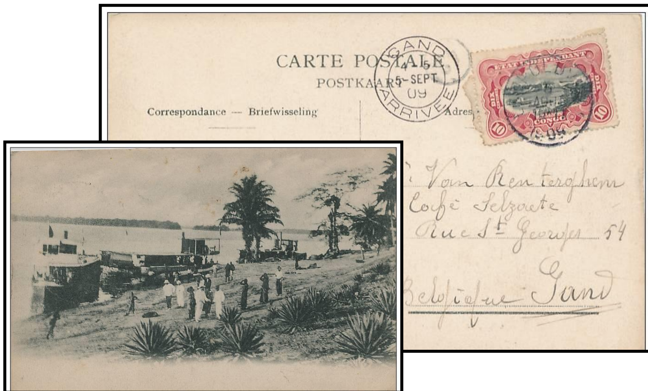
Carte-vue partie de Mombongo le 26 juin 1909 à destination de Gand où elle parvint le 4 septembre ; annulation du timbre au passage par Léopoldville le 5 août 1909.

Tarif : carte-vue au tarif imprimé à 10 c (malgré la mention CARTE POSTALE non biffée) Affranchissement : 10 c carmin I4+A5.